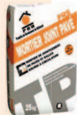
PRB MORTIER JOINT PAVÉ