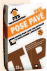
PRB POSE PAVÉ