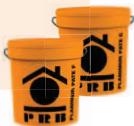
PRB PLANIMUR PÂTE F ET G