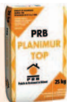
PRB PLANIMUR TOP